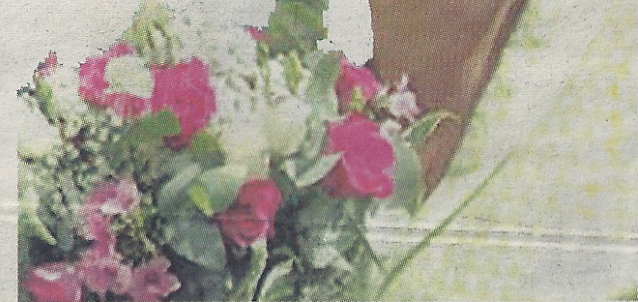
■ Camilla Parker-Bowles est une cousine éloignée de Céline Dion et Madonna.